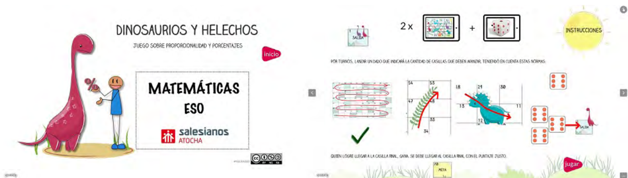
Imagen 4. Juego de matemáticas

Mi primera creación con Genially , sin embargo, no fue un libro interactivo, sino un juego de matemáticas.