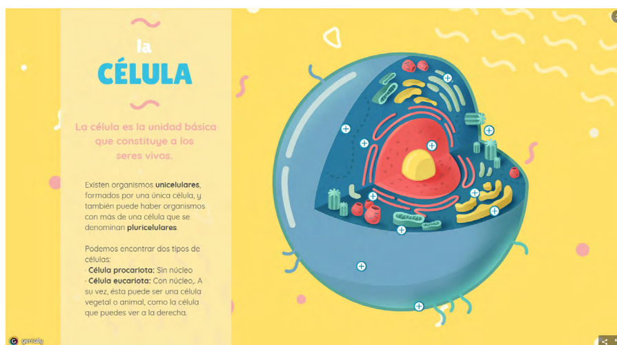
Imagen 1. Ejemplo de presentación interactiva. Enlace a página