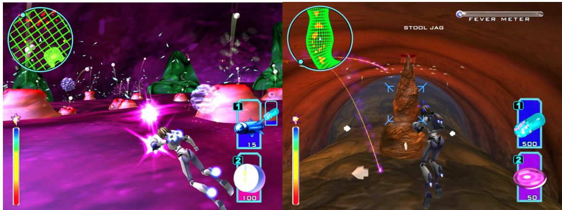
Figura 1. Captura del juego Re-Mission.

Sistema Greenify. Se trata de un juego con estética de red social en el que se busca que el jugador adquiriera conocimientos sobre el medioambiente (figura 2). Para “enganchar” al usuario se llevaron a cabo diferentes tácticas: los jugadores tenían que superar una serie de misiones en el mundo virtual que se representaba en el juego, y dependiendo del éxito obtenido, conseguían unos puntos. También tenían la posibilidad de compartir artículos relacionados con el medioambiente, lo que les permitía conseguir más puntos e incluso que los demás usuarios valorasen dicha información. Gracias al reconocimiento de los demás, los jugadores escalaban en un ranking (estatus social) que servía como reconocimiento público de la actuación del usuario en el juego.