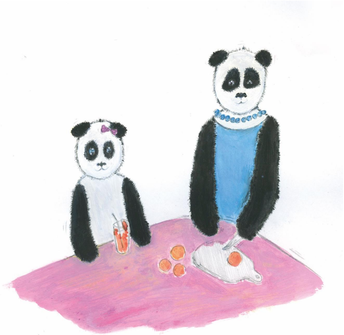
TOÑA Y MAMÁ