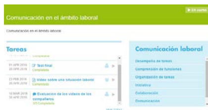
Fig. 2. Actividad propuesta y tareas asociadas

Como se formaron cuatro equipos, se facilitó un caso diferente a cada uno de ellos. En el primer caso, los participantes tenían que atender las llamadas dirigidas a su jefe, ya que se encontraba en una reunión; en el segundo caso, los participantes debían recoger el correo postal que llegase a la empresa y distribuirlo entre los diferentes departamentos; en el tercer caso, los participantes debían acudir a una reunión como jefes del almacén para recoger necesidades de material y distribuir los pedidos de los diferentes departamentos que conforman la empresa y; en el cuarto caso, los participantes ejercen como encargados de almacén que recorren los departamentos anotando los materiales que se necesitan en cada uno de ellos.