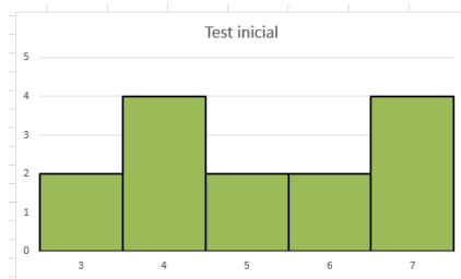
Fig. 3. Resultados del test de evaluación inicial

Las Figuras 3 y 4 muestran los resultados obtenidos por los participantes en el test de evaluación inicial y en el test de evaluación final. En ambas figuras, el eje horizontal representa el número de respuestas correctas en el test mientras que el eje vertical representa el número de alumnos que obtuvieron un determinado número de aciertos.