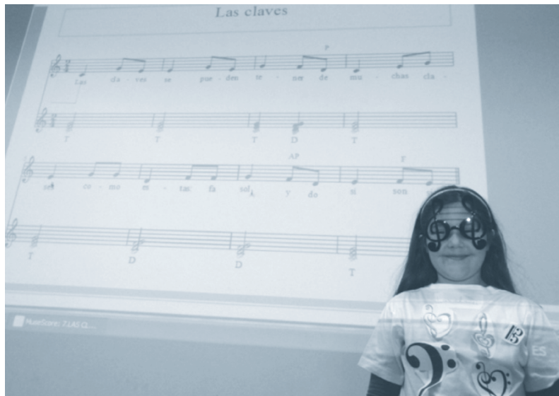
Figura 2. Interpretación en clase de la canción creada por una alumna.

Para el análisis de los datos, se establecieron siete categorías que, a su vez, se organizaron en dos grandes bloques temáticos, según su relación con el primero o el segundo de los objetivos de la investigación: importancia de arriesgarse para mejorar la educación (objetivo 1), la innovación frente a la estabilidad de lo tradicional (objetivo 2), lo invisible y lo visible de la innovación (o. 1), innovación adaptada a la realidad (o. 2), utilización de las TIC en la educación musical actual (o. 2), paciencia y perseverancia para la obtención de resultados (o. 2), la importancia del apoyo de la comunidad educativa (o. 1).