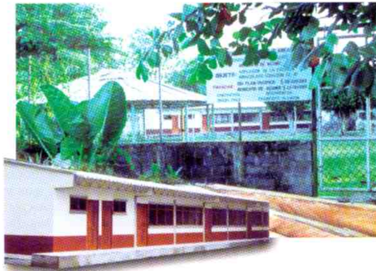
Escuela Inmaculado Corazón. Municipio de Acandí - Chocó.

Este componente ha centrado su gestión en la puesta en marcha del Programa de Mejoramiento de la Calidad de la Educación Básica y Media en el Pacífico, en el marco del cual se financiaron acciones tendientes