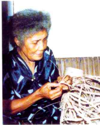
Artesana tejiendo trenza.

2. La economía extractiva dominante en la región incluye ciclos de auge y