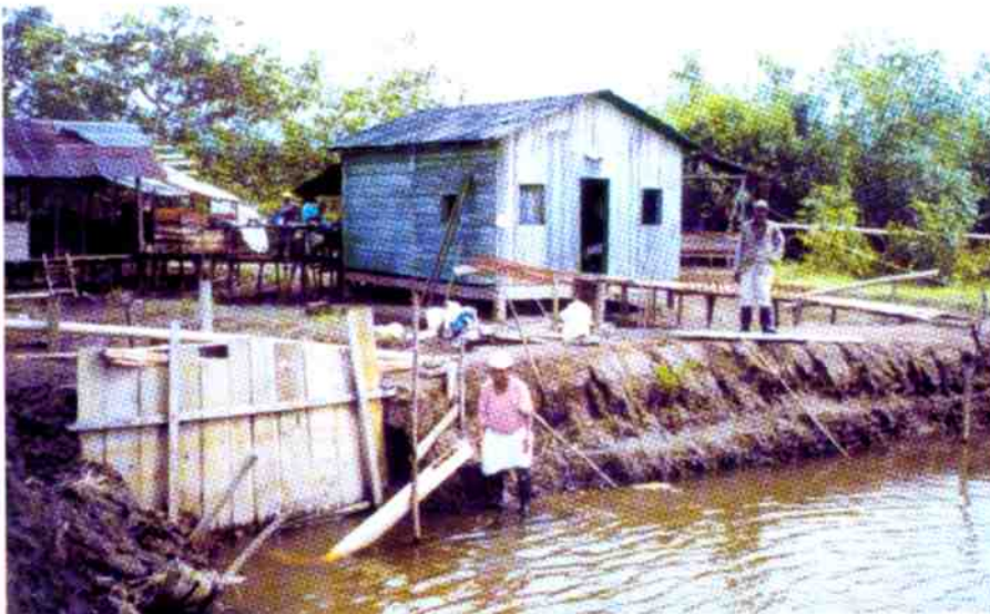
Estanque piscícola de cultivo de camarón. Camaroneras de Tumaco