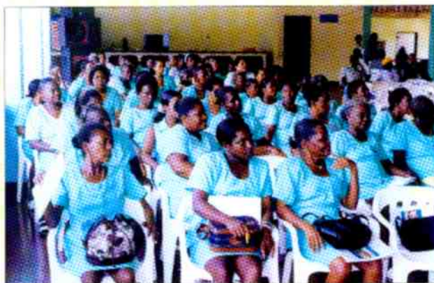
Mujeres parteras del pacífico

ción de Municipios del Pacífico colombiano , como estrategia para la construcción de un pensamiento regional, el mejoramiento en la interlocución en el nivel nacional con las administraciones municipales y la integración de otros actores a la gestión de lo público.