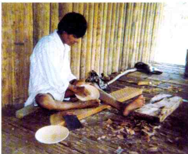
Talla en madera. Proceso de acabado de bateas.

Sistemas de Producción Agropecuaria: se apoya el desarrollo de procesos productivos mediante la implementación de herramientas tecnológicas adecuadas a la escala y contexto.