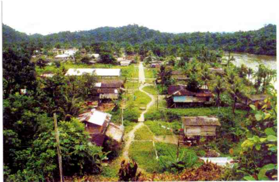
Municipio López de Micay

Ha llevado a cabo alianzas estratégicas con algunos ministerios