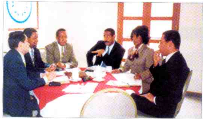
Equipo técnico del Programa Plan Pacífico.

E l Programa es liderado por el Gobierno Nacional. Estuvo adscrito al Departamento Nacional de Planeación hasta el 31 de diciembre del año 2000.