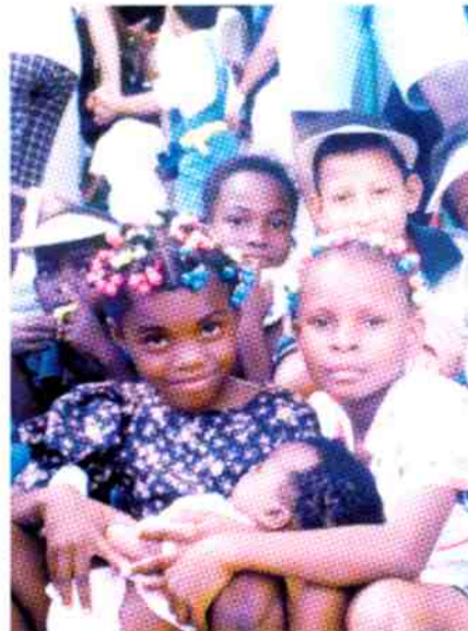
La ejecución del Programa Plan