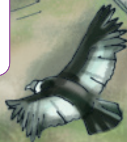
Cóndor Vultur gryphus

La fauna es muy variada y posee al menos 230 especies de aves, 140 de mamíferos, 175 de peces, 65 de reptiles y 40 de anfibios, casi la mitad de estos últimos son exclusivos del parque, como es el caso del sapito amarillo de Mucubají, en peligro crítico de extinción. Entre la rica variedad de aves llaman la atención el colibrí chivito de los páramos (muy asociado al frailejón), el pato de torrentes y el majestuoso cóndor, ave que fue cazada hasta su desaparición y de la cual raramente se observan algunos individuos reintroducidos o provenientes de Colombia.