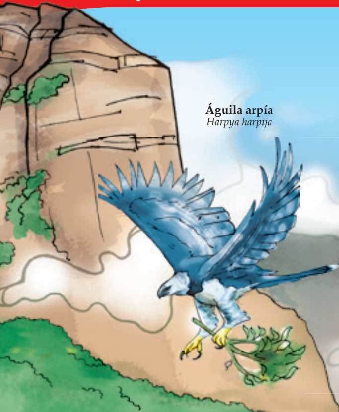
Águila arpía Harpya harpija