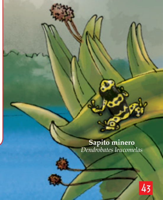
Sapito minero Dendrobates leucomelas

Desde la cima del magnífico Auyantepuy se desprende el Kerepakupai Vená , que en lengua pemón significa «salto del lugar más profundo». Con una altura de 979 metros, es la caída de agua de mayor elevación en el planeta, casi veinte veces más alta que las cataratas del Niágara. Su nombre popular de Salto Ángel es un homenaje al piloto estadounidense Jimmy Ángel, quien lo dio a conocer para el mundo. Con frecuencia es confundido con el Churún Merú, salto de 400 metros que nace en el mismo tepuy. El Salto Ángel quedó entre las veintiocho finalistas de las «Nuevas siete maravillas» del concurso promovido por New7Wonders Foundation .