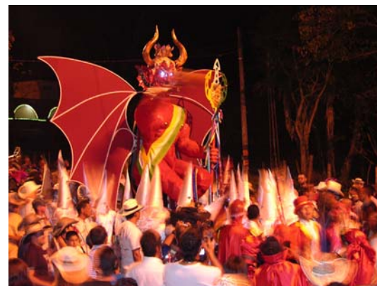
Entrada del diablo para su presentación oficial durante el Carnaval de Riosucio.