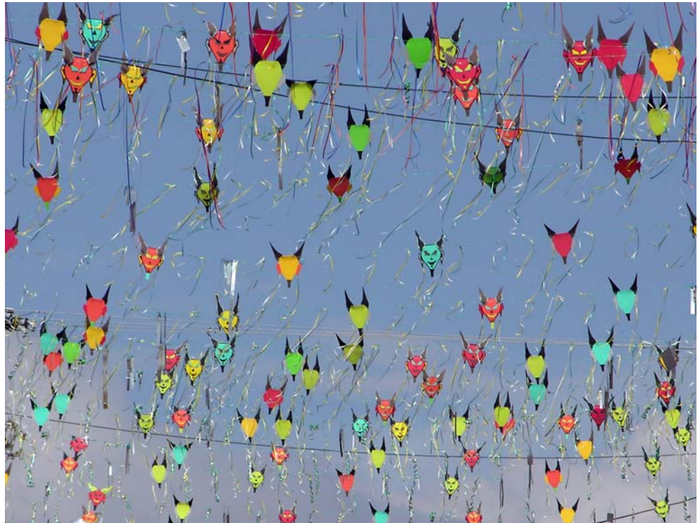
Máscaras al viento, Carnaval de Riosucio.