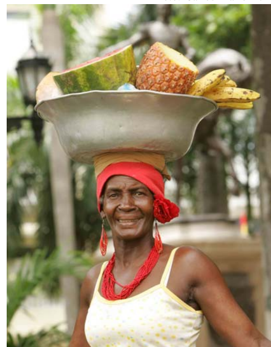
San Basilio de Palenque se dio a conocer en el Caribe mediante el pregón de sus mujeres, quienes llevan el legado de un pueblo que se resiste a perder sus tradiciones.