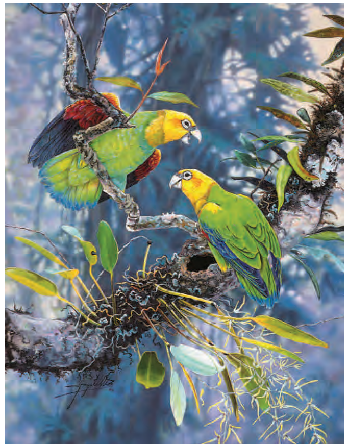
Ángel Ulloa. Perico cabecidorado [ilustración] Libro Rojo de la Fauna Venezolana. (1999). Caracas: Provita-Fundación Polar.

Además de las alarmas especializadas están los cantos, que son vocalizaciones mucho más complejas con funciones tales como el señalamiento del dominio territorial, la exploración en búsqueda de la hembra, el contacto con la pareja. Estos contactos, en algunas especies de aves, constituyen duetos con alto valor comunicativo.