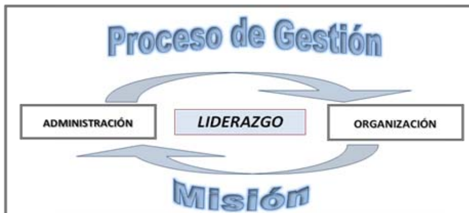
Diagrama 2 Síntesis Concepto emergente de Gestión

El concepto de gestión puede aplicarse a distintos ámbitos institucionales que constituyen un conjunto genérico de tipologías. (Ver Diagrama 3 )