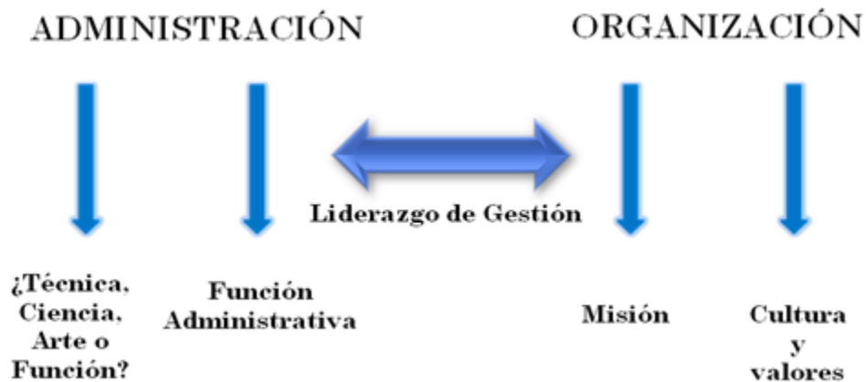
Diagrama 1 Origen e implicaciones del concepto de Gestión

En América Latina y el Caribe, la literatura especializada registra un cambio significativo en el concepto mismo de gestión escolar , que pasa de entenderse como una función puramente técnica, administrativo –contable, centrada en la persona individual del director o directora, a una función centrada en la cultura organizacional y la acción educativa y social de las escuelas. Pilar Pozner comenta: La gestión escolar no es una construcción arbitraria y aislada; pertenece a un ámbito social específico; se reconoce como una organización social que le da sentido y fuerza como proyecto de transformación de los seres humanos [Pozner, 1998].