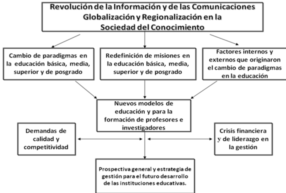
Diagrama 4. Cambio de paradigmas en los sistemas educativos

La estrategia anterior resulta equivalente o similar a la que ha adoptado el Proyecto Escolar (PE) , denominado también Plan Estratégico de Transformación Escolar (PETE) como se lo propuso instrumentar el Programa Escuelas de Calidad (2001-2006). (Ver Diagrama 5 )