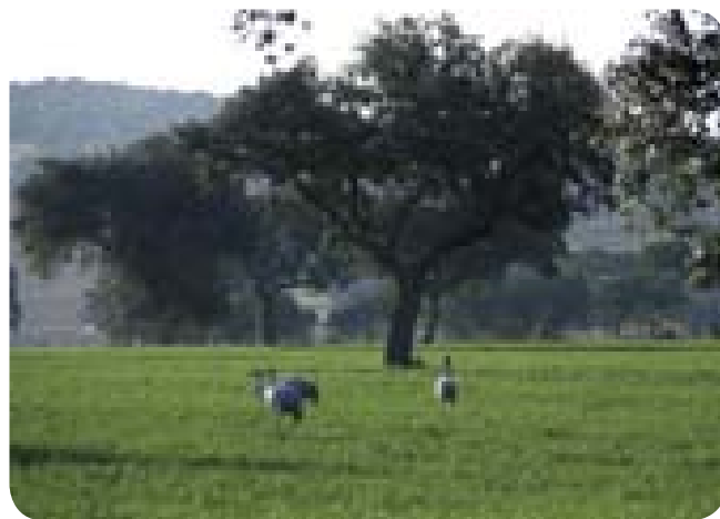
●●● Biodiversidad: dehesa y grullas

Paisaje. - Las zonas quemadas pierden el valor paisajístico, sus posibilidades reales o potenciales como espacios para el turismo y la recreación.