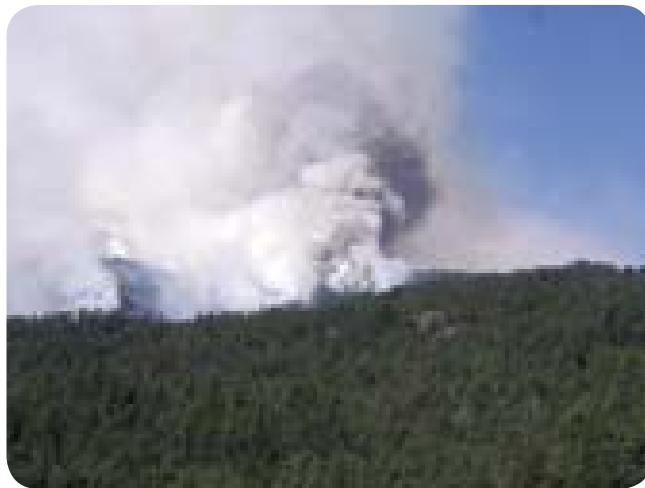
●●● Incendio forestal