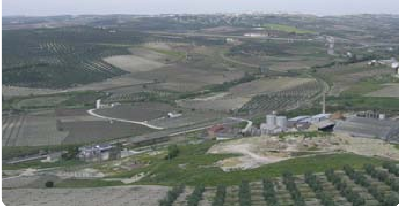
●●● Transformación del paisaje