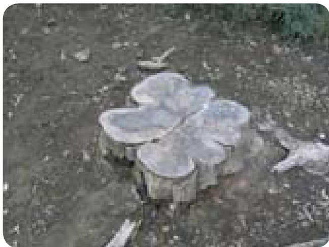
●●● Árbol talado