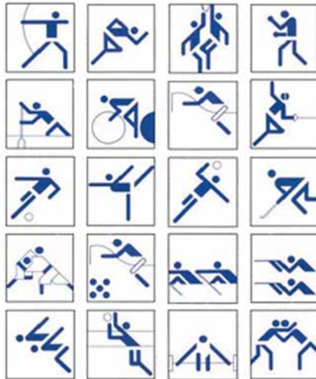
Munich, 1972 Otl Aicher