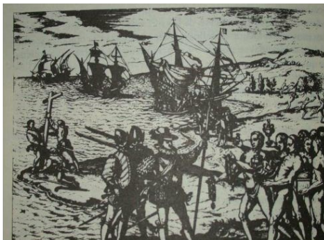
Llegada de Colón. Grabado de 1594 por Theodor de Bry ( http://www.sip.uiuc.edu/people/melendez/span442/ImagenesdeColon.html )

ma abstracta y compleja, como se ha encontrado en el estudio de la evolución de los conceptos históricos y sociales (véase el apartado anterior sobre conceptos históricos).