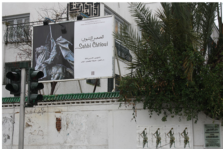
21 Casa de las Artes, Parque del Belvedere, Túnez. Marzo de 2010.