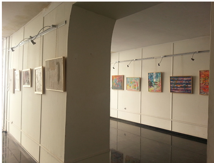
10. Galería de Arte "Asselah Hocine" , Argel. Septiembre de 2013.