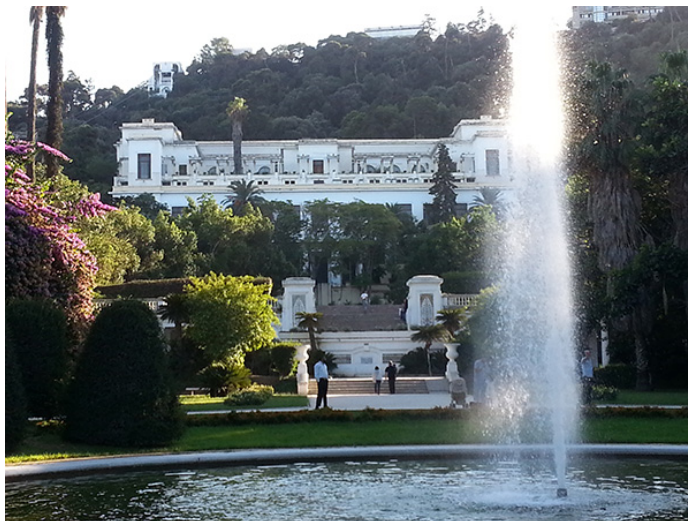
1 y 2. Museo de Bellas Artes, Argel. Septiembre 2013.