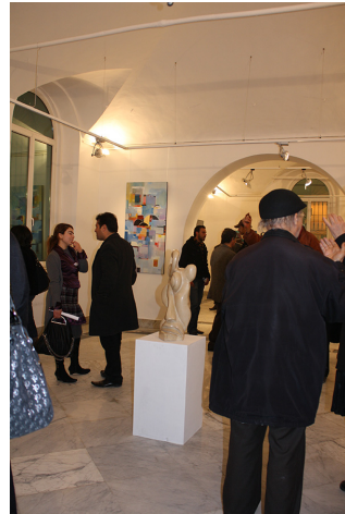
23 y 24. Exposición de la Union de Artistas Tunecinos, UAPT, marzo 2010.