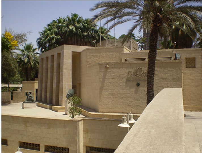
13. Museo de Mahmoud Mokhtar, El Cairo. Junio de 2008.