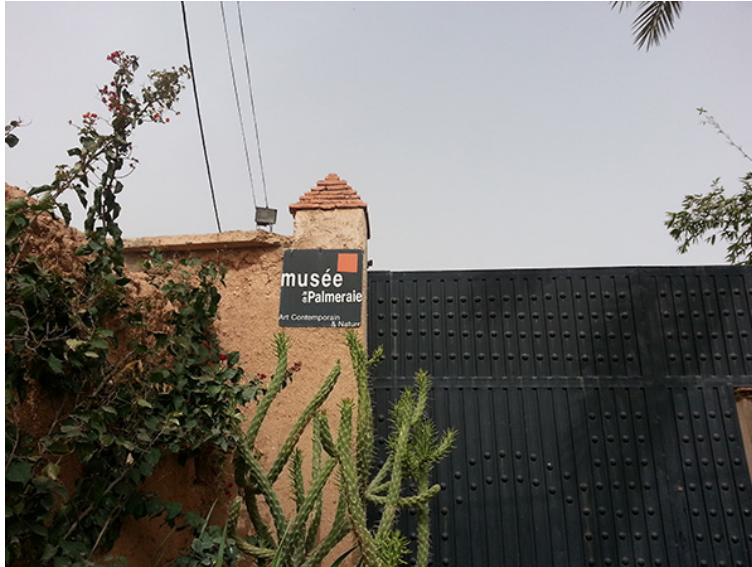
48. Musée de la Palmeraie, Marrakech. Marzo de 2014.