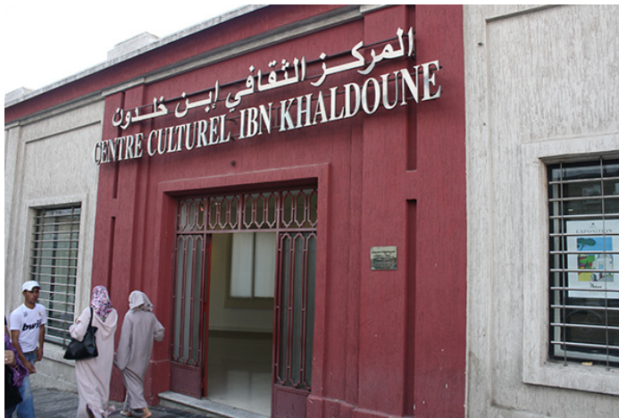
51. Galeria Ibn Khaldoun, Tánger .Septiembre de 2010.