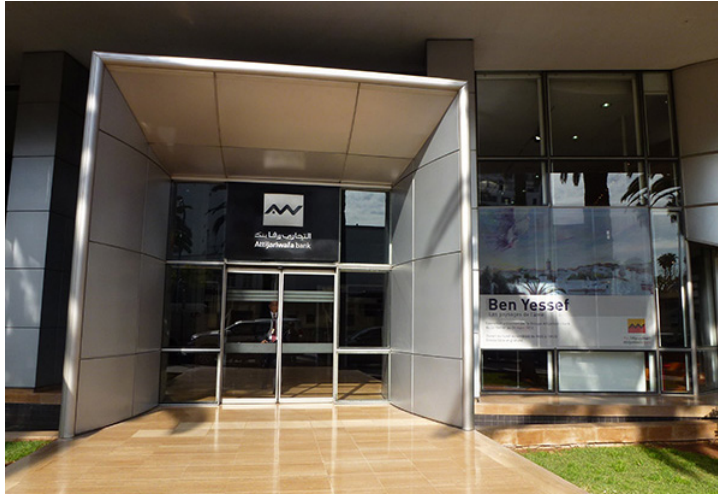
50. Espace Actua, Fundación AWB. Casablanca. Marzo de 2012.