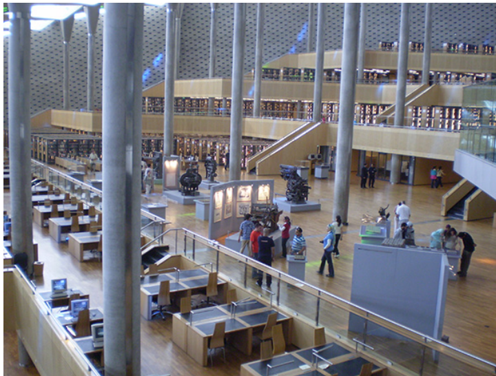
11 y 12 Nueva Biblioteca de Alejandría. Detalles. Alejandría, Junio de 2008.