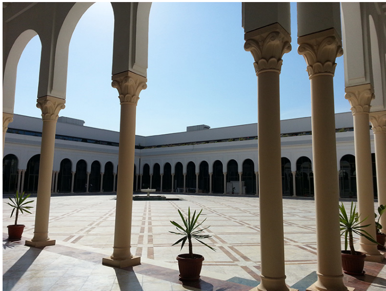
5 y 6. Palacio de la Cultura "Moufdi Zakaria", Argel. Exterior y patio interior. Septiembre de 2013.