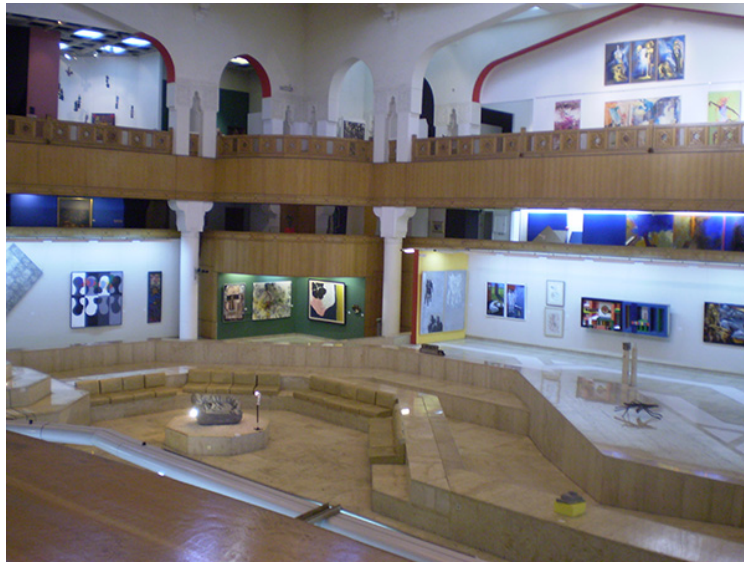
15 y 16. Museo de Arte Moderno Egipcio, El Cairo. Junio de 2008.