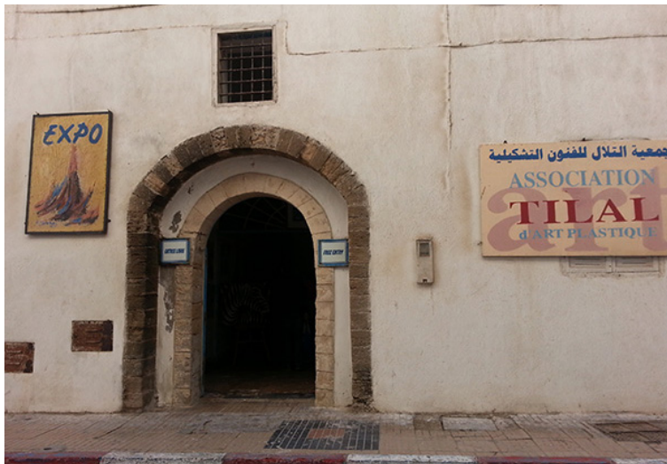
49. Galería de la Asociación "Tilal" de Artes Plásticas. Esauira, Marruecos. Marzo de 2014.