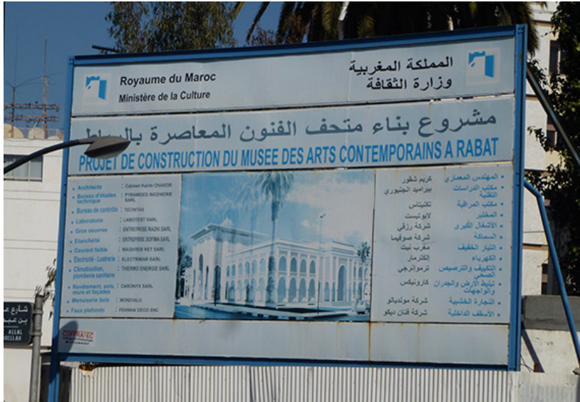
38 y 39. Museo de Arte Moderno de Rabat, en construcción . Abajo: Cartel de obra con los datos del Proyecto. Marzo de 2012.