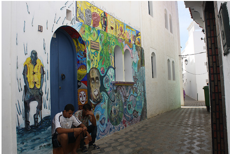
45. Galería de arte Monassilah, Asilah, Marruecos. Septiembre de 2010.