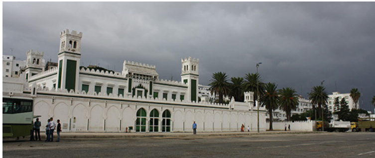
41. Centro de Arte Moderno de Tetuán, CAMT, antes de su inauguración. Septiembre de 2010.