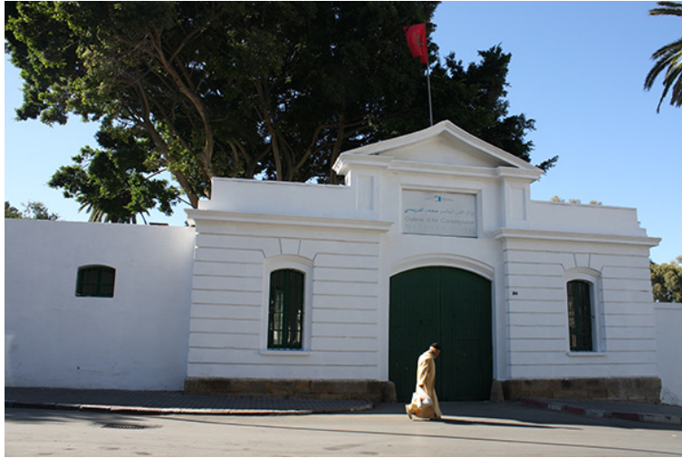
42. Galería de Arte Contemporáneo Mohamed Drissi. Tánger, Marruecos, Septiembre de 2010.