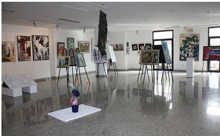
33. Galería Yahia, Túnez. Aspecto de la exposición con motivo del salón de la UNAP. Marzo de 2010.