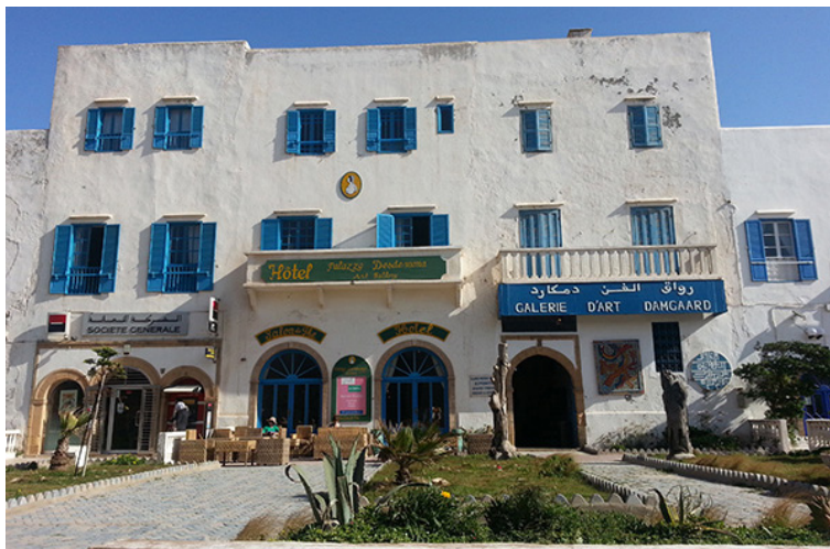
47. Galería Frederick Damgaard, Esauira, Marruecos. Marzo de 2014.