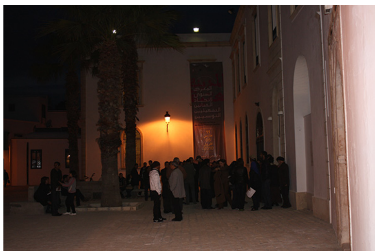
22. Palacio Kheireddin, Túnez. Inauguración de la Exposición de la UAPT, Marzo de 2010.