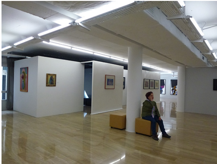
58 y 59. Espace d'art Société Générale , Casablanca. Marzo de 2012.