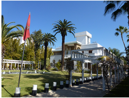
56 y 57. Villa des Arts Fundación ONA, Rabat. Marzo de 2012.