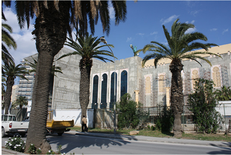
30. Complejo Cultural Cité de la Culture en la Avenida Mohamed V de Túnez capital, en construcción. Detalle. Marzo de 2010.