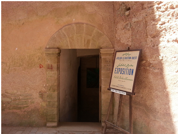
37. Taller Le bastion Ouest , Esauira. Marzo de 2014.