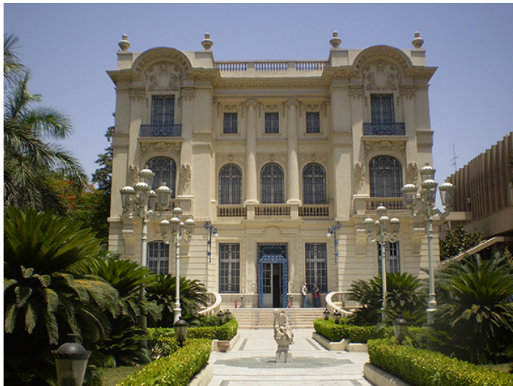
18. Museo Mahmoud Khalil , El Cairo. Junio de 2008.