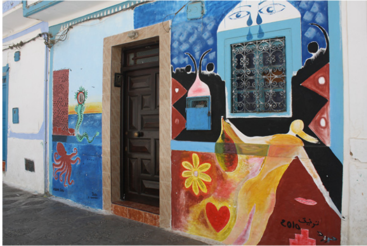
44. Pintura en la calle, Asilah. Septiembre de 2010.