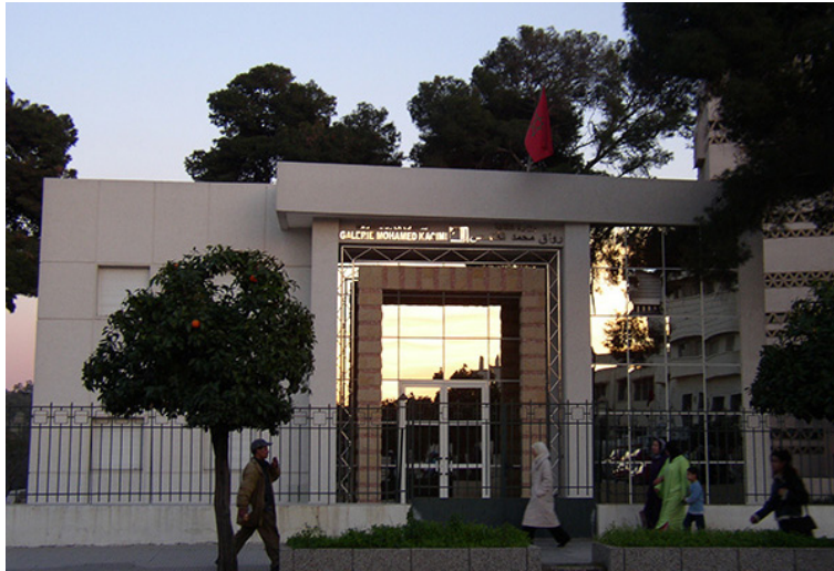
40. Galería Mohamed Kacimi, Fez. Febrero de 2007.