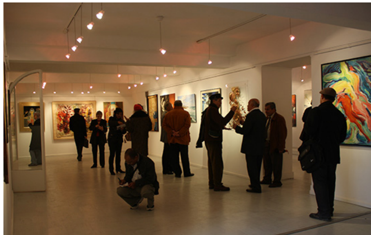
25. "Maison des Arts", Túnez. Inauguración de la Exposición de la UAPT, Marzo de 2010.