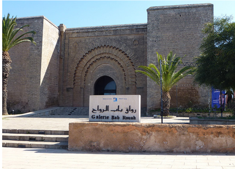
34. Galeria Bab Rouah , Rabat. Marzo de 2012.