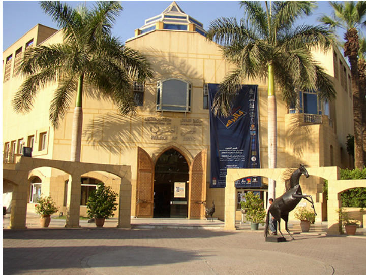
17. Palacio de las Artes , El Cairo, Gezira, Junio de 2008.