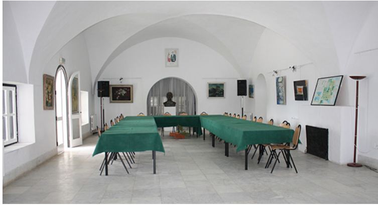
32. Dar Sebastian. Centro internacional cultural, Hammamet, Túnez. Marzo de 2010.