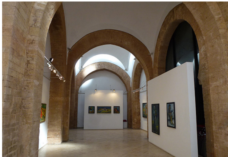
35. Galeria Bab Rouah , Rabat. Marzo de 2012.