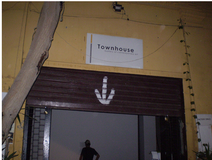
19. Galería de arte Townhouse , El Cairo. Detalle. Junio de 2008.