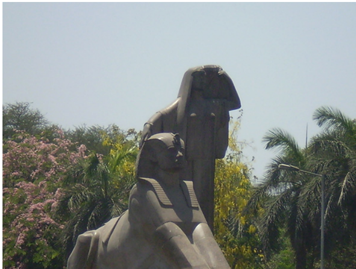
14. Estatua "Nahdet Misr", Renacimiento de Egipto, Mahmoud Mokhtar. El Cairo. Junio de 2008.