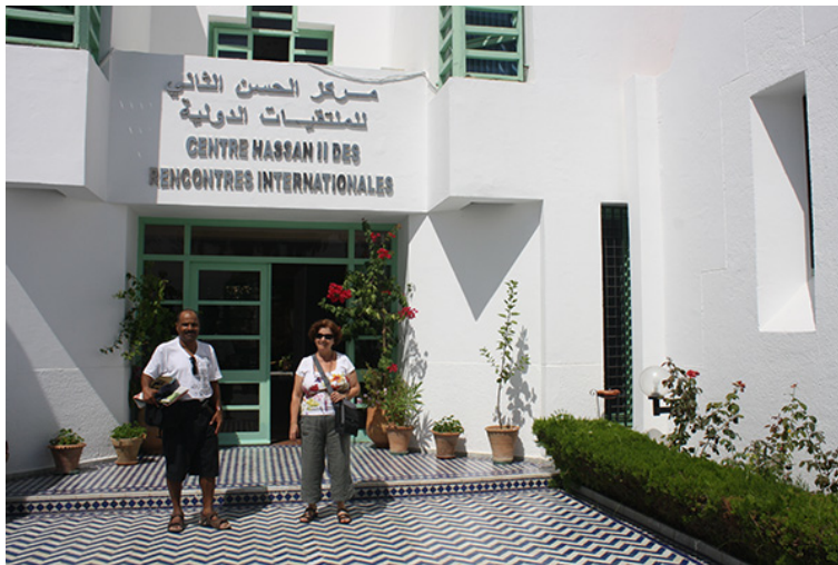
43. En el Centro Hassan II de Encuentros Internacionales. Asilah, Marruecos. Septiembre de 2010.