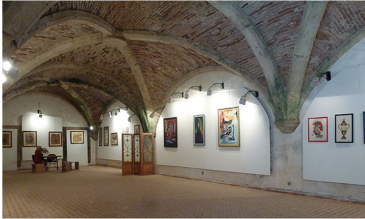
46. Galería Chaïbia Talal, El Jadida. Marzo de 2012.