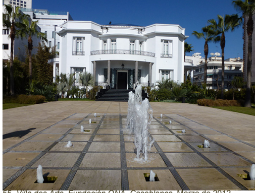
55. Villa des Arts, Fundación ONA, Casablanca. Marzo de 2012.