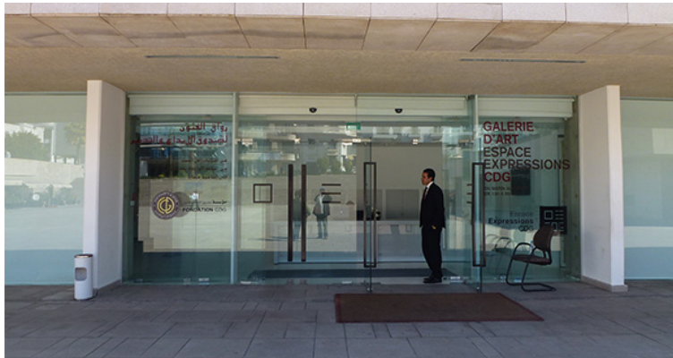
54. Espace Expressions, Rabat. Marzo de 2012.