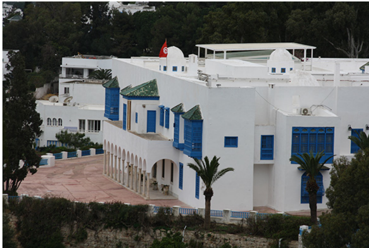
31. Centro de Músicas Arabes y Mediterráneas, Ennejma Essahra, Palacio del Barón de Erlanger, Sidi Bou Said , Túnez. Marzo de 2010.