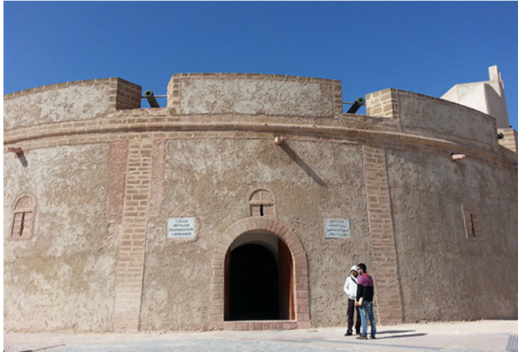
36. Galería Borj Bab Marrakech, Esauira. Marzo de 2014.