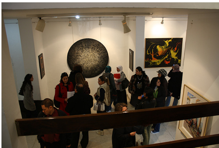
26. Palacio Kheireddin , Túnez. Asistentes a la Exposición de la UAPT, Marzo de 2010.