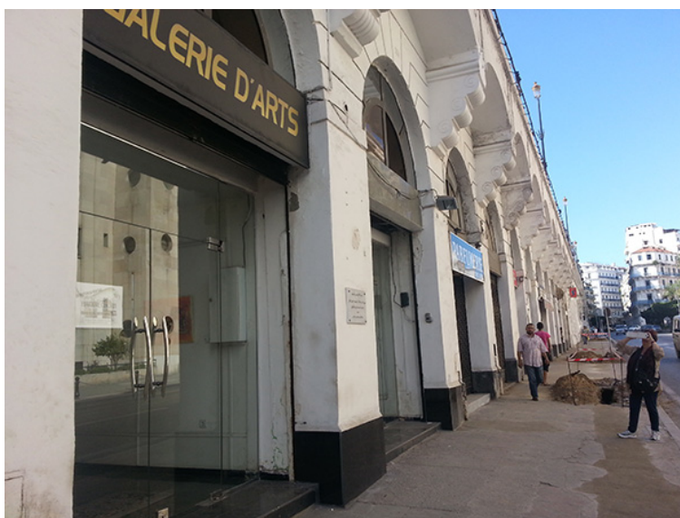
8. Galeria de Arte "Asselah Hocine", Argel. Septiembre de 2013.