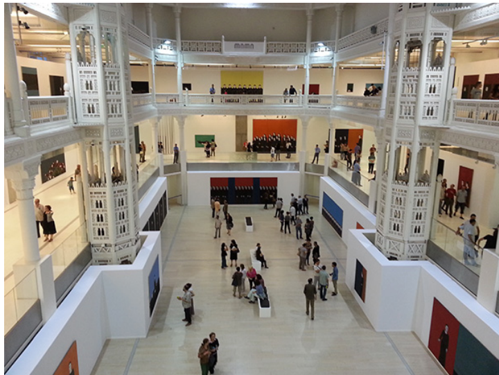
3 y 4. Museo de arte Moderno de Argel, MaMa. Exterior y conjunto interior. Septiembre de 2013.