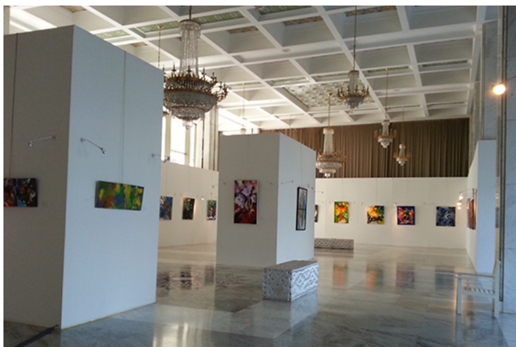
7 "Galeria Baya" Palacio de la Cultura "Moufdi Zakaria", Argel. Septiembre de 2013.