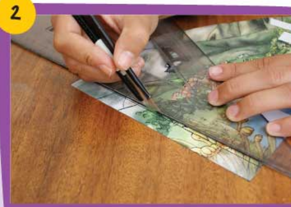
2 Por la línea punteada marca las solapas con la parte no afilada de una cuchilla.