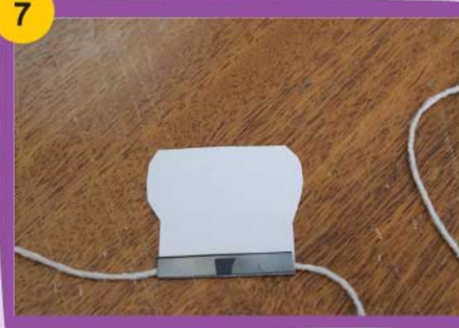
7 Corta un pedazo de hilo grueso o estambre y pégalo de la solapa de la pieza Sierra Nevada Teleférico, tal como está en la foto.

Sigue los pasos del 1 al 6 con cada una de las piezas del parque. Recuerda siempre mantener el orden de numeración de las piezas. Pega el hilo donde está colgado el teleférico entre las dos montañas, como muestra la foto.