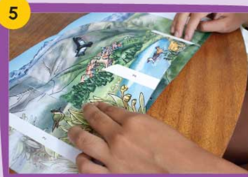
5 Coloca cada solapa en los espacios identificados con el N° 1 sobre la base. Mantenlas firmes hasta que sequen.