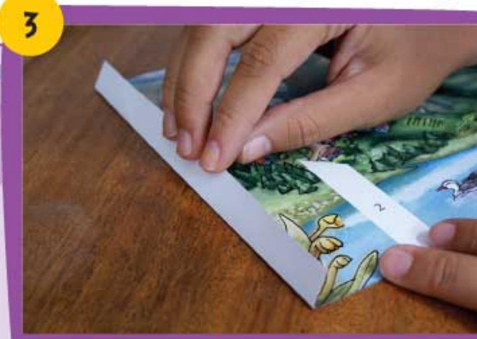
3 Realiza los dobleces de cada solapa de la pieza Sierra Nevada 1 siguiendo la línea punteada.