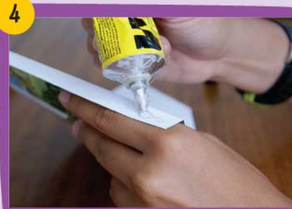
4 Coloca pegamento en el reverso de cada solapa de la pieza Sierra Nevada 1.