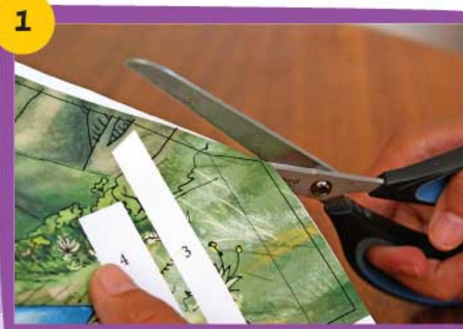
1 Recorta con cuidado la pieza Sierra Nevada 1 siguiendo siempre la línea negra exterior.