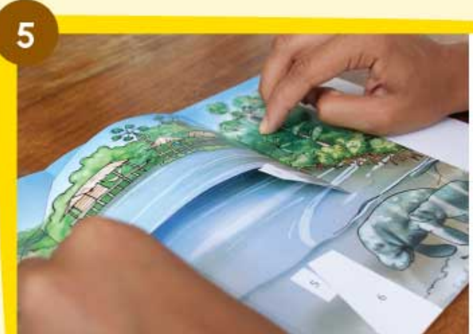
Coloca cada solapa en los espacios identificados con el N° 1 sobre la base. Mantenlas firmes hasta que sequen.