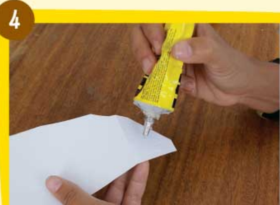
Coloca pegamento en el reverso de cada solapa de la pieza Delta 1.