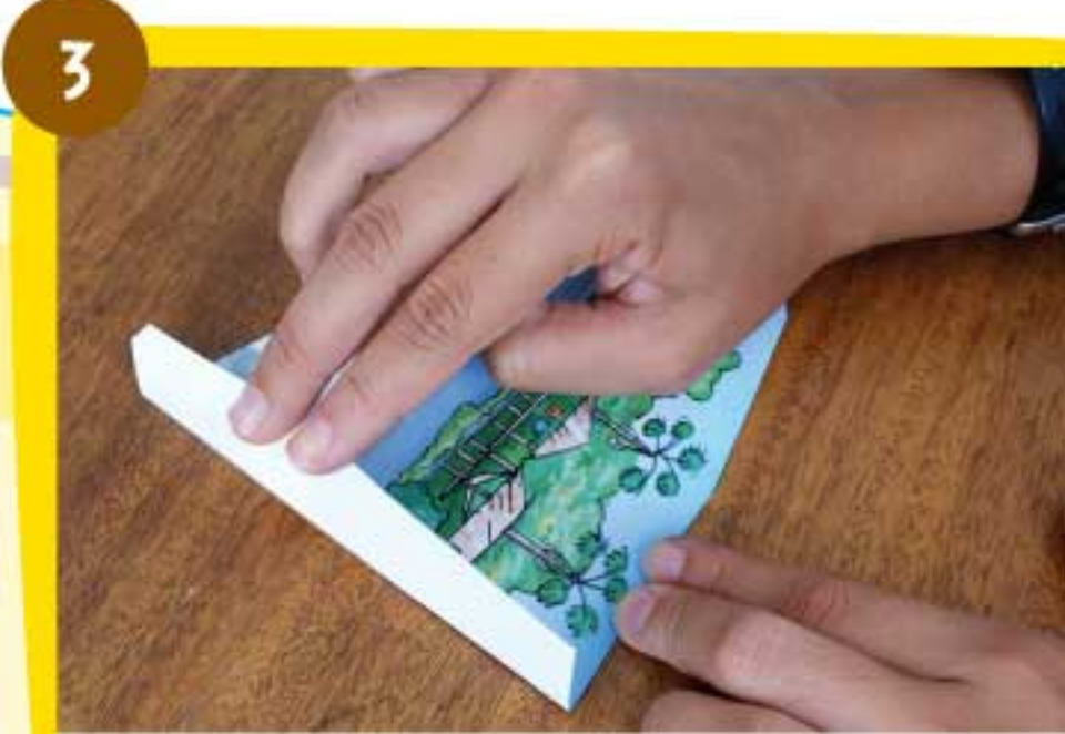
Realiza los dobleces de cada solapa de la pieza Delta 1 siguiendo la línea punteada.