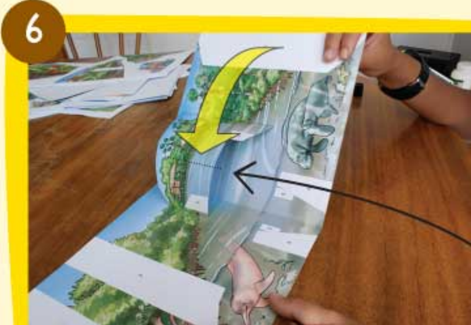
Dobla la base con cuidado hasta que logres comprimir la pieza Delta 1 y generar el doblez en la mitad de ella.

Sigue los pasos del 1 al 6 con cada una de las piezas del parque. Recuerda siempre mantener el orden de numeración de las piezas.