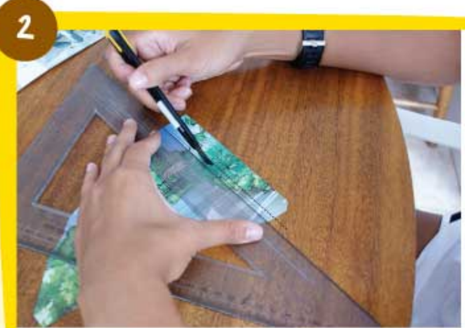
Por la línea punteada marca las solapas con la parte no afilada de una cuchilla.