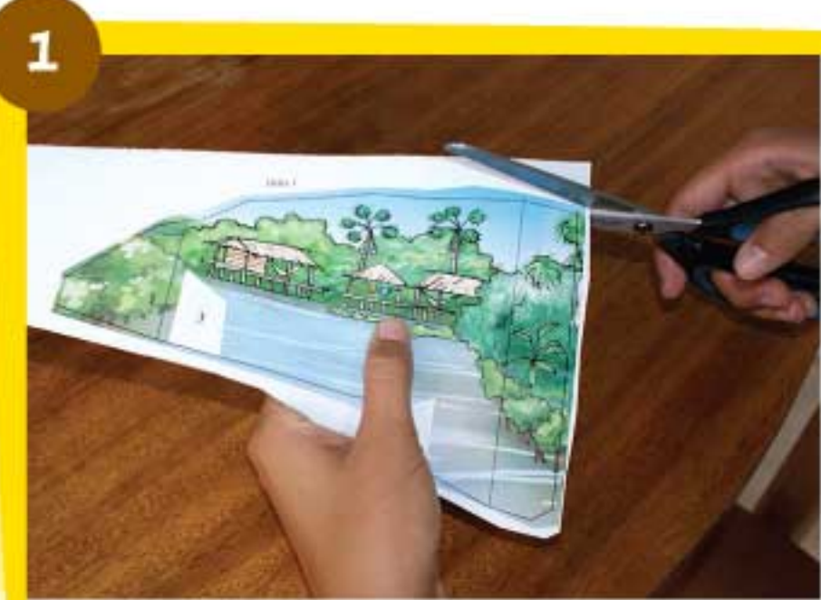
Recorta con cuidado la pieza Delta 1 siguiendo siempre la línea negra exterior.