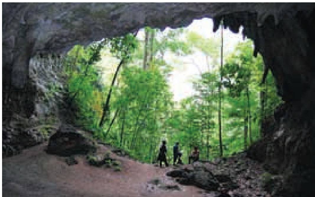
Parque Nacional Cueva de la Quebrada del Toro.

Ubicado en la sierra falconiana, su principal atractivo es una gran cueva de más de 1 600 metros de longitud, atravesada por un río subterráneo navegable en algunos tramos por botes pequeños. Protege quebradas y ríos que abastecen de agua a varias comunidades. Entre su variada fauna y flora típica de bosques siempreverdes y semidecuidos, destacan grandes colonias de guácharos y otras especies cavernícolas.