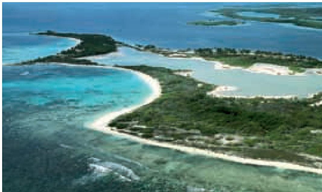
Parque Nacional Morrocoy.

Famoso por sus cristalinas aguas azules, playas de arenas blancas, arrecifes coralinos y manglares. También abarca herbazales halófilos en los cayos y las costas, cardonales y bosque semicaducifolio en las colinas. Posee un gran atractivo turístico para el uso de sus playas y para actividades como el buceo, el velerismo, el esquí acuático, los paseos en bote y las acampadas en sitios establecidos.