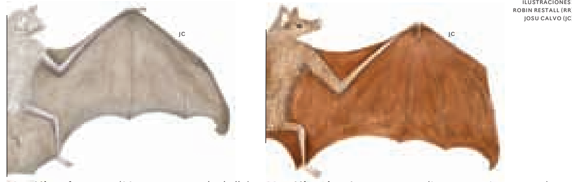
Murciélago fantasma ( Mormoops megalophylla )

Es la única ABRAE de su tipo en Venezuela, y tiene como propósito preservar las cuevas El Pico, El Guano, Piedra Honda y Jacuque, y la fauna que en ellas habita, especialmente murciélagos, incluyendo algunos migratorios.