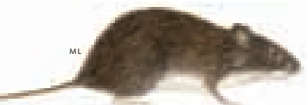
Ratón mochilero de Paraguaná Heteromys oasisicus