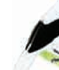
Pájaro herrero Procnias averano

Las mayores alturas, donde se ubican áreas húmedas y densos bosques, ofrecen un panorama que contrasta con las depresiones y tierras más áridas: grandes mamíferos comparten extensas zonas selváticas con aves llamativas, como el tucán pico de frasco y el paují copete de piedra.