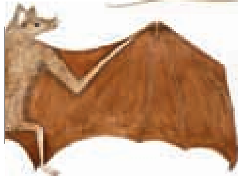
Murciélago cardonero Leptonycteris curasoae