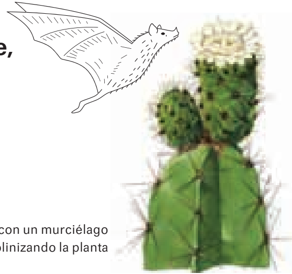
Cardón en flor con un murciélago polinizando la planta