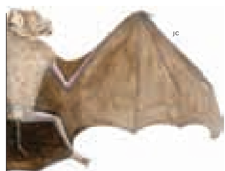
Murciélago bigotudo Pteronotus parnellii

En Paraguaná habita una tarántula de vivos colores, de abdomen anaranjado y cuerpo azul metálico ¡Parece una joya del desierto! También es hogar de otras especies únicas como el murciélago bigotudo, un ratón mochilero, una marmosa y el toqueque de Monte Cano.