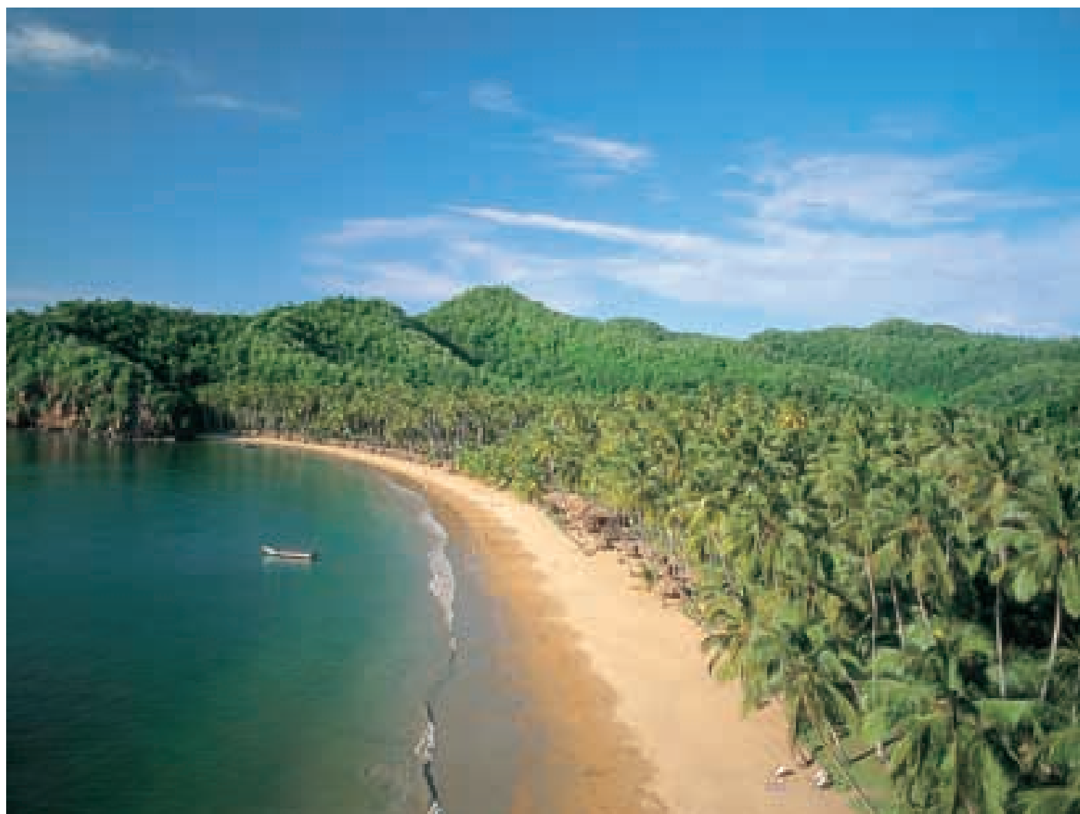
Playa Medina, península de Paria, estado Sucre.