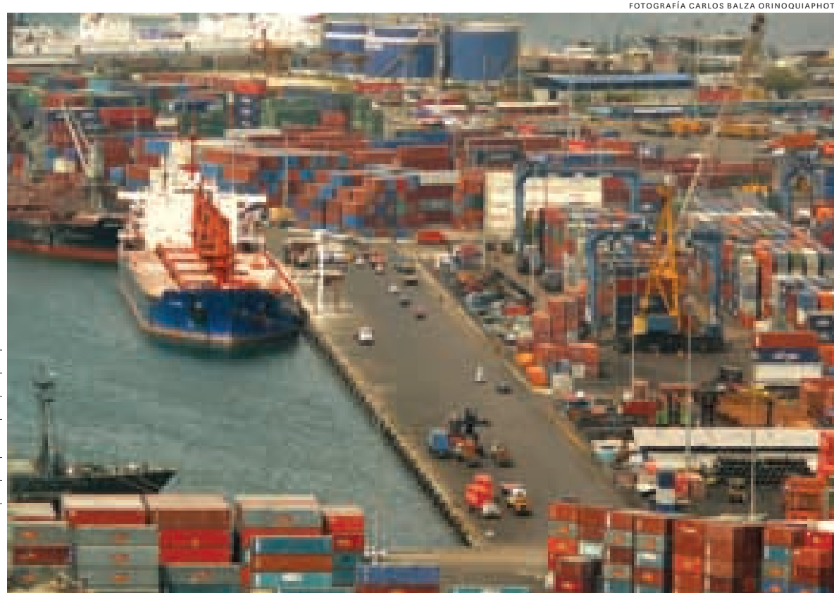
Puerto Cabello, estado Carabobo.