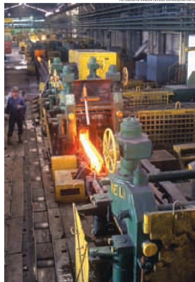
Fábrica de cabillas, La Yaguara, Caracas. La región concentra importantes zonas industriales en Carabobo, Aragua, Miranda y el Distrito Capital.