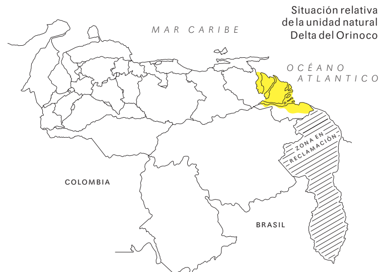
Situación relativa de la unidad natural Delta del Orinoco

LOCALIZACIÓN DE LA UNIDAD NATURAL DELTA DEL ORINOCO UNIDAD NATURAL DELTA DEL ORINOCO LÍMITE INTERNACIONAL LÍMITE ESTADAL