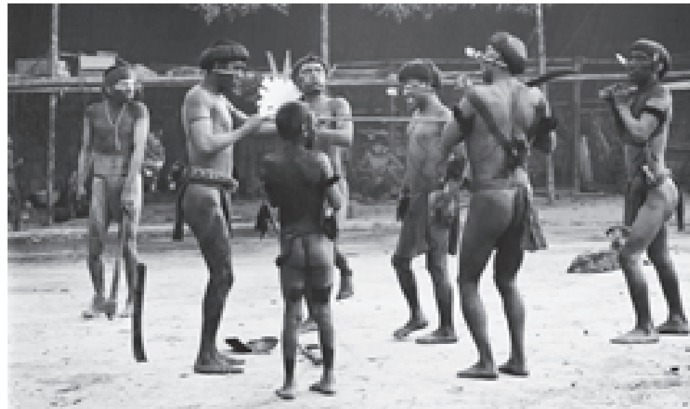
Indígenas de la etnia yanomami.

unidades de vegetación, y se estiman más de 4 000 especies de plantas, de las cuales unas 500 serían endémicas. En fauna se conocen 180 especies de mamíferos, 650 aves, 70 reptiles, 53 de anfibios y más de 320 especies de peces. Es la principal área ancestral de la etnia yanomami en Venezuela, y parte del territorio ye'kuana, así como de otros pueblos indígenas.