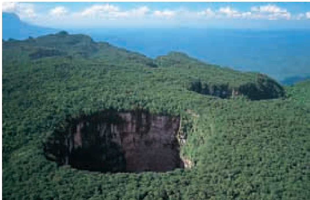
Sima del Sarisariñama.

en profundidad vertical (502 m), equivalente a un edificio de 140 pisos. Presenta grandes extensiones de bosques, arbustales y herbazales característicos de la región, con diversidad de especies incluyendo varios endemismos. Es parte de los territorios ancestrales de los pueblos ye'kuana y sanemá.