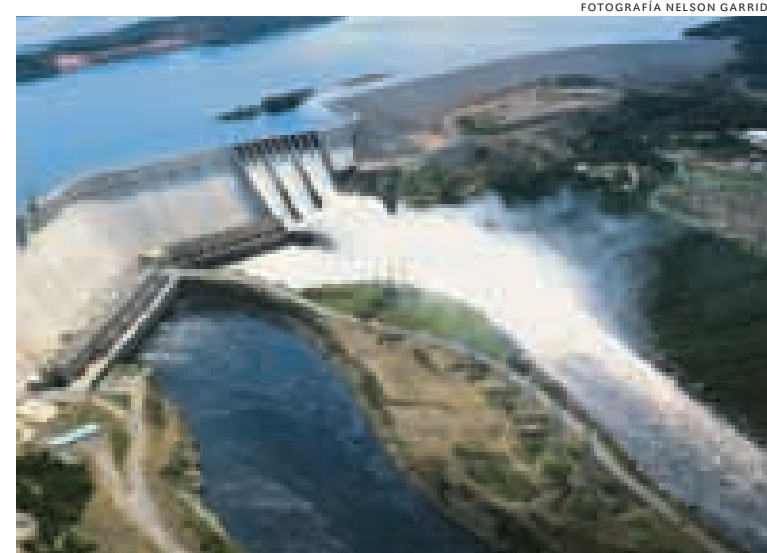
Embalse Simón Bolívar (Guri).

Esta voz indígena tiene dos significados: una serpiente muy venenosa (Bothrops atrox) y un ave rapaz, halcón macagua (Herpetotheres cachinnans).