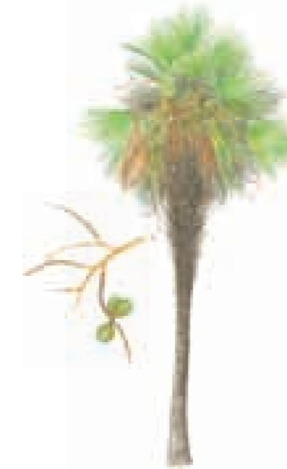
Nombre común: Palma llanera Nombre científico: Copernicia tectorum Altura: 10–15 metros Detalle: Frutos Unidad de vegetación: Sabana estacionalmente inundable con palmas Piso: Tierras bajas (1)