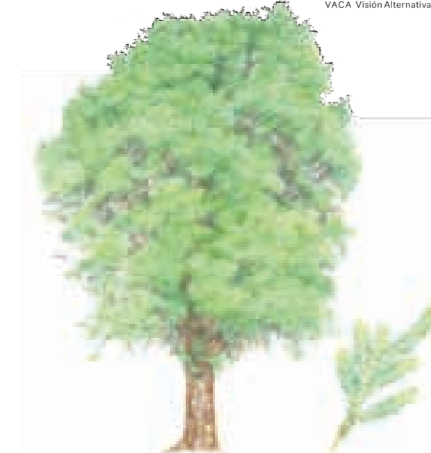
Nombre común: Pino laso Nombre científico: Decussocarpus rospigliosii Altura: 20-30 m Detalle: Rama con hojas Unidad de vegetación: Bosque siempreverde montano (Bosque nublado) Piso altitudinal: Montano Franja: Montana (4, 12, 21) ILUSTRACIONES MERCEDES MADRIZ