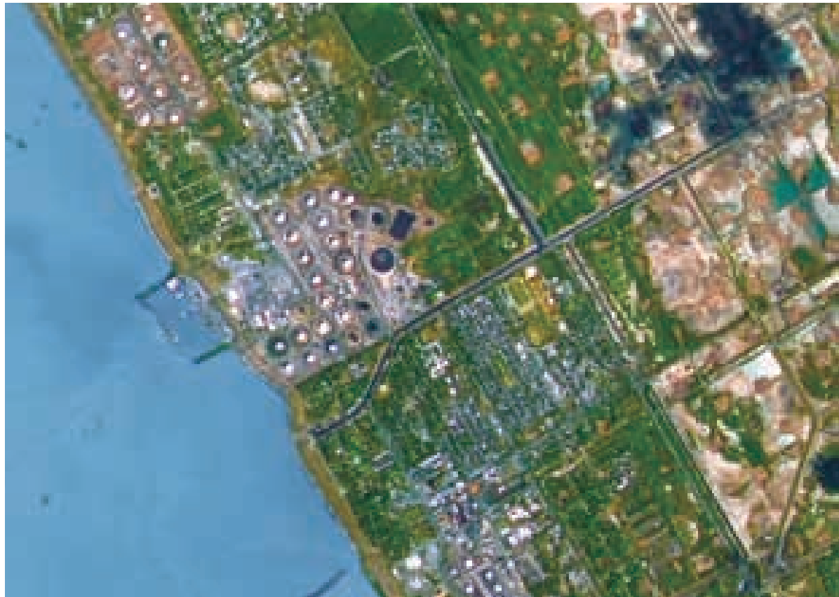
Lagunillas , centro poblado vinculado a la explotación petrolera. Se aprecian patios de tanques, muelles petroleros y la red rectangular asociada a la explotación del petróleo.