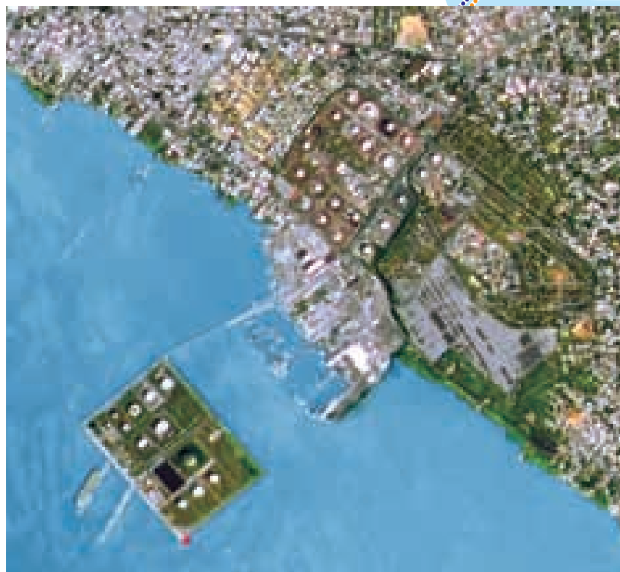
Cabimas , la segunda ciudad más importante después de Maracaibo. Desarrollada a partir del inicio de la extracción de petróleo en 1931. Se observa la isla artificial de La Salina, que constituye un centro de almacenamiento y transporte de crudo. Los puntos blancos que se observan en el lago de Maracaibo son pozos petroleros.