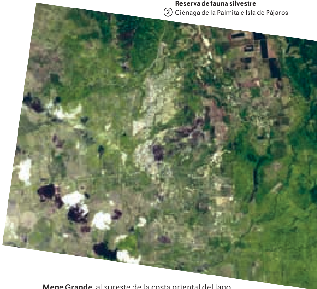
Mene Grande , al sureste de la costa oriental del lago de Maracaibo, representa el inicio de la explotación de petróleo en Venezuela a través del pozo productor Zumaque I, que reventó en 1914. Es un centro poblado que hoy sirve de apoyo a una importante actividad agrícola.